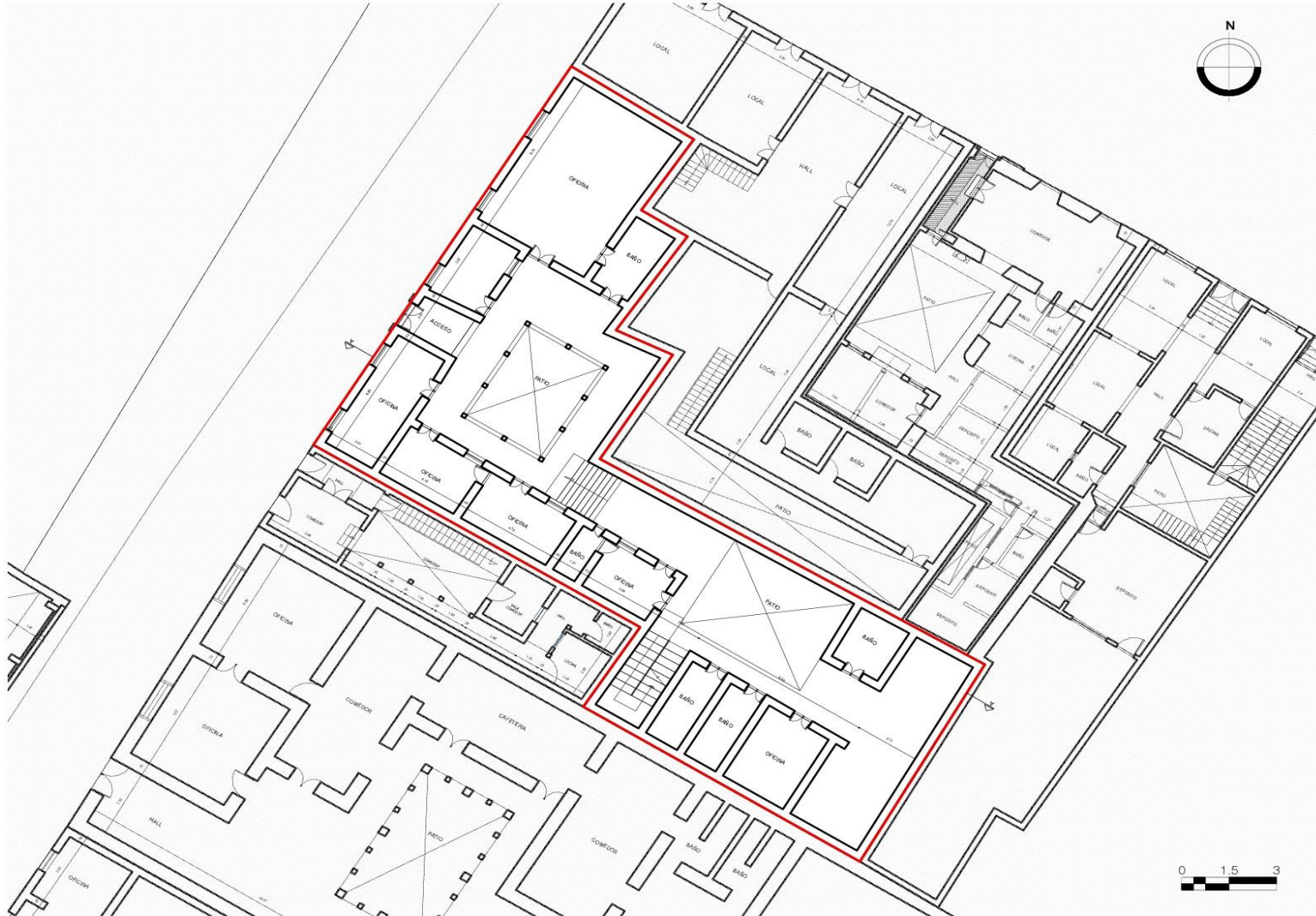
Planta primer piso